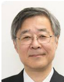
唐澤 剛 内閣官房 まちひとしごと創生本部